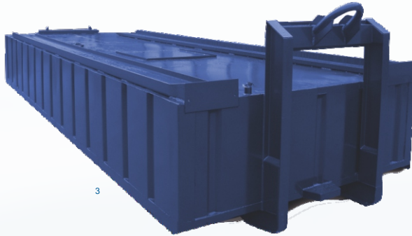
Abwassertank ca. 11 m 3

Wir bieten für nahezu jeden Container und jede Gelegenheit den passenden Tank. Details für eine genaue Planung Ihrer Baustelle oder Veranstaltung erhalten Sie direkt bei uns.